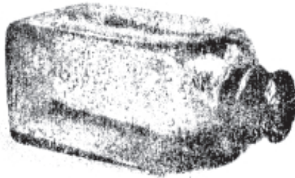
Verkorkte Weinflasche, Mitte 17. Jahrhundert