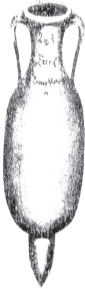
Griechische Amphore, vorchristliche Zeit